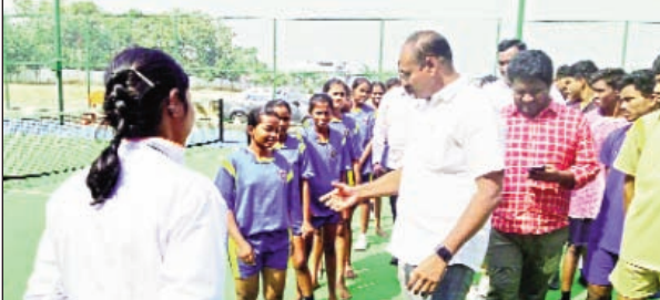
కొత్తగూడెం టౌన్, నవంబర్ 21 - ప్రభాతవార్త:

ఒలంపిక్ అసోసియేషన్ ఆధ్వర్యంలో అందర 14, 17 రాష్ట్రస్థాయి బాక్సింగ్ ఎంపికలు జరిగినవి. స్థానిక ప్రగతి మైదానంలో గురువారం బాలురు, బాలికల విభాగంలో రాష్ట్ర స్థాయి సెలక్షన్ జిల్లా ఒలంపిక్