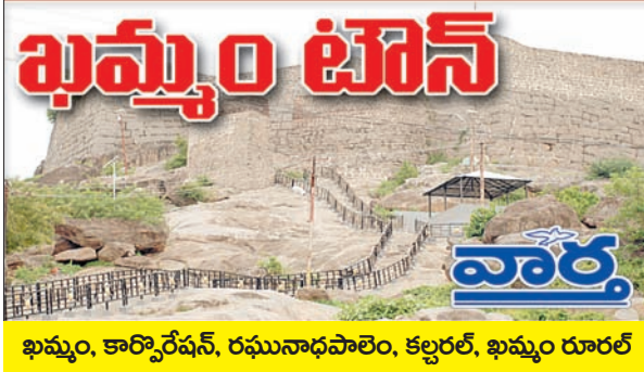
ఖమ్మం, కార్పొరేషన్, రఘునాథపాలెం, కల్లరల్, ఖమ్మం రూరల్