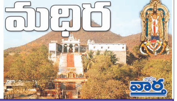
మధిర, బోనకల్, చింతకాని, ఎర్రపాలెం, ముదిగొండ

అనుకుంటున్నారు, తల్లిదండ్రుల ఆశయం మొదలగు వివరాలను కలెక్టర్, పిల్లలను అడిగి తెలుసుకున్నారు. డిజిటల్ లాబ్ లో పిల్లలతో కలెక్టర్ నేలపై కూర్చోని డిజిటల్ క్లాస్ ను వీక్షించారు. కంప్యూటర్ యొక్క ప్రయోజనాలు, మారుతున్న టెక్నాలజీ వలన పిల్లలకు మంచి, చెడు గురించి ఆయన వివరించారు. ఈ సందర్భంగా జిల్లా కలెక్టర్ మాట్లాడుతూ జీవితంలో నిర్దేశించుకున్న లక్ష్యాల సాధన దిశగా విద్యార్థులు ఇప్పటి నుంచే కృషి చేయాలని అన్నారు. పాఠశాల విద్యార్థులు తాము నిర్దేశించుకున్న గమ్యాలను ప్రతి రోజూ ఉదయం లేవగానే ఒకసారి డైరీలో రాసుకోవాలని అన్నారు. లక్ష్యం సాధన దిశగా మన ప్రయాణం చేరుకునేందుకు మనల్ని మనం సన్నద్ధం చేసుకోవాలని కలెక్టర్ విద్యార్థులకు సూచించారు.