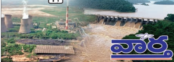
పాల్వంచ, ములకలపల్లి, లక్ష్మీదేవిపల్లి, చంద్రగిరి