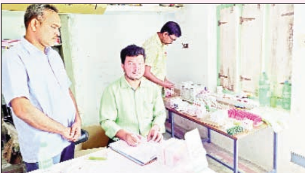
కొత్తగూడెం టౌన్, నవంబర్ 21 - ప్రభాతవార్త: